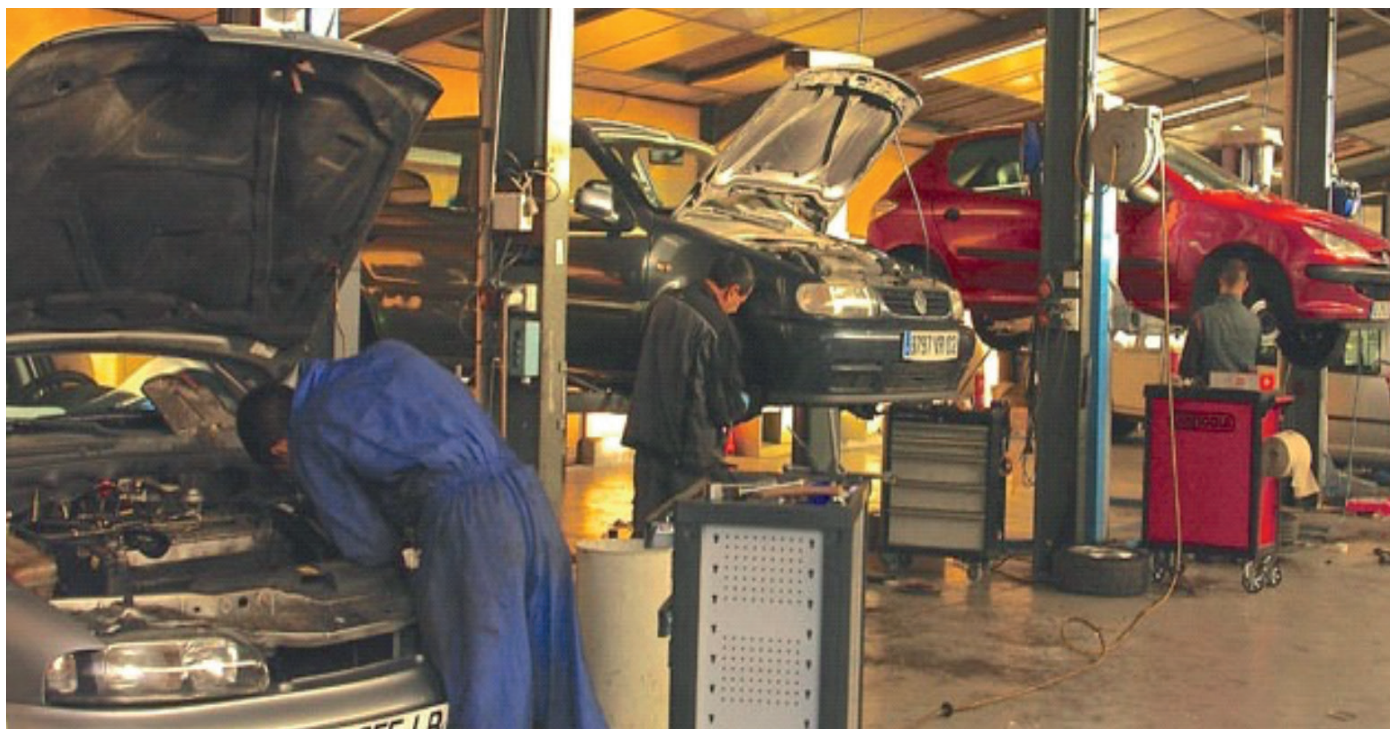
Solidarauto 49 : 54 rue Eugénie Mansion à Belle Beille - 50 Bd Charles de Gaulle à Trélazé

Par ailleurs nous recyclons, en particulier, les pneumatiques usagés. Chaque année, la société Aliapur qui collecte et recycle les pneus usagés nous informe des économies environnementales réalisées. En 2019, ont été économisés l'équivalent de 80 878 litres d'eau, de 5 623 litres de diesel et de 63 578 kWh d'électricité.